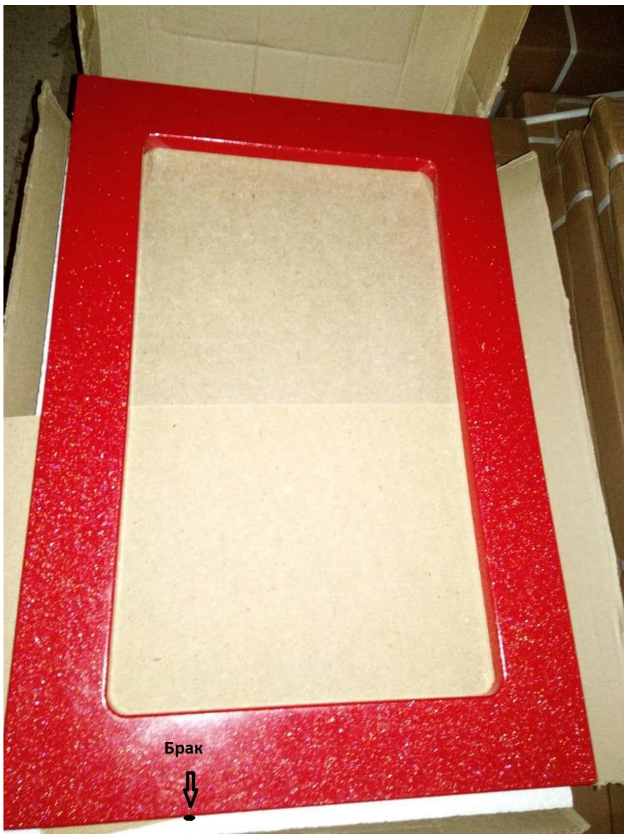
Фото 1. Делаем фотографию поврежденного товара (общий план)